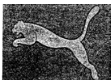
圖2 Puma跳躍美洲獅商標(註冊於尼斯分類第18、25、28類)