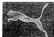
圖2 Puma跳躍美洲獅商標(註冊於尼斯分類第18、25、28類)