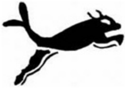
圖3 Sinda Poland欲申請之商標(註冊於尼斯分類第25類)

「本文同步刊登於TIPS網站 ( https://www.tips.org.tw ) 」