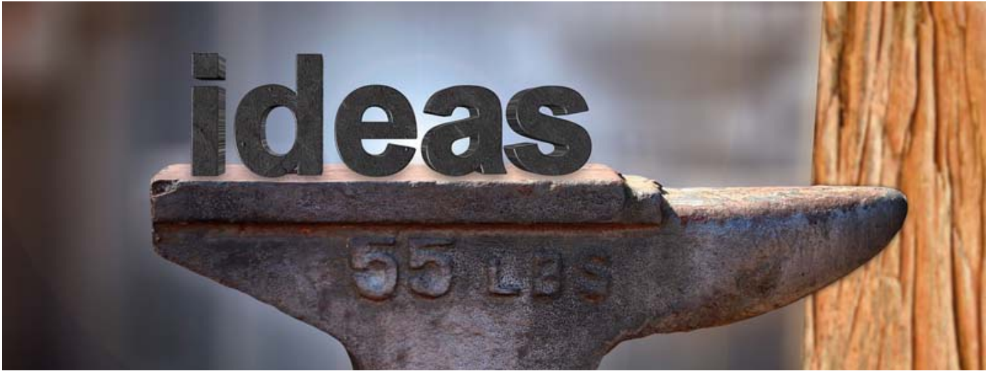
日本對於中小企業之智財協助措施—以知的財產推進計畫2018之具體實施內容為例