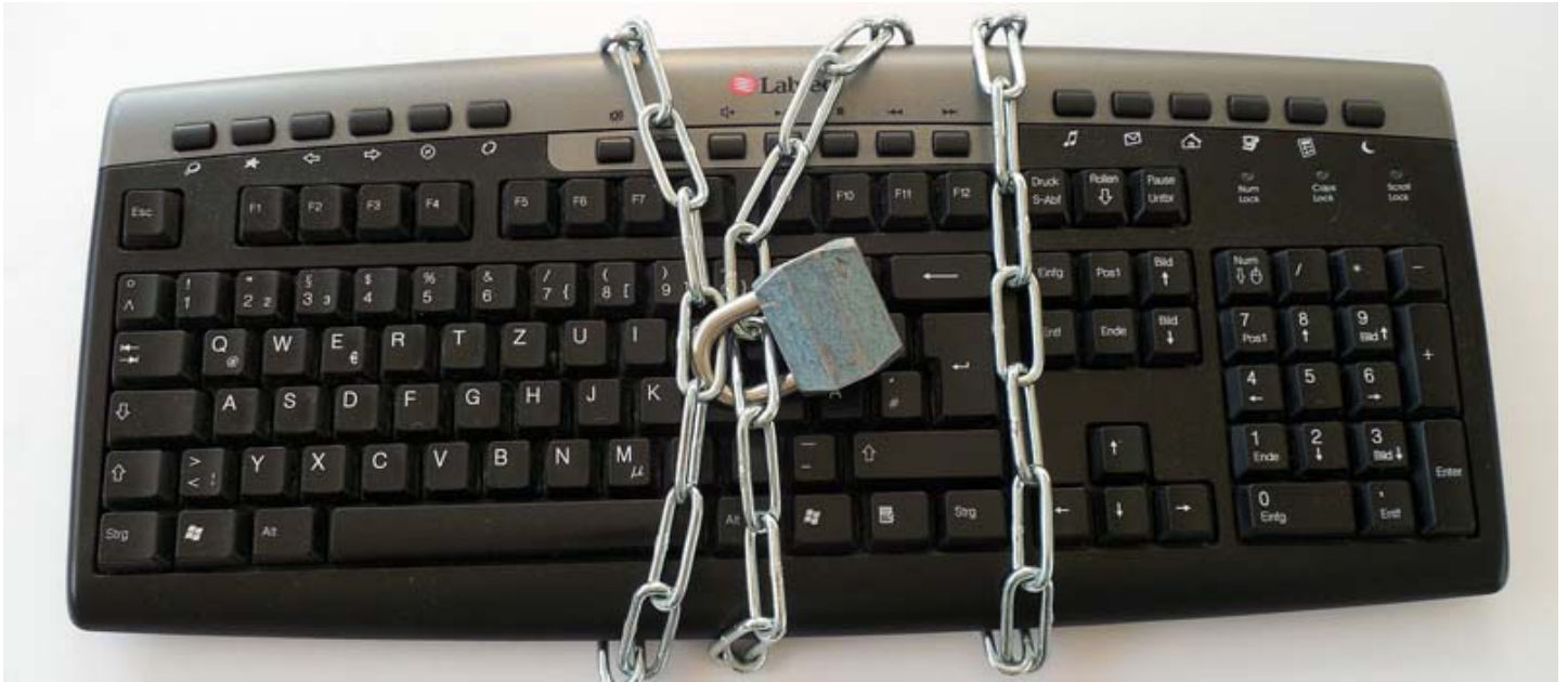
我國關於個人資料去識別化實務發展