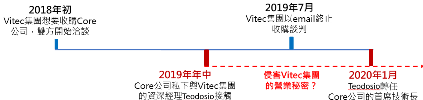
圖1 本案相關重要時點

Core公司於2019年年中開始與Teodosio私下進行會議，Teodosio並陸續將Anton/Bauer的機密資訊提供給Core公司。其後，Teodosio於2020年1月離職轉任Core公司的首席技術長，Core公司並於2020年春季，重啟了停產的微型電池專案，並推出了新的微型電池產品，接著於2020年秋季推出功能和操作相當類似於Cine VCLX電池的產品，上述兩項產品皆為Anton/Bauer的競爭性產品[17]。