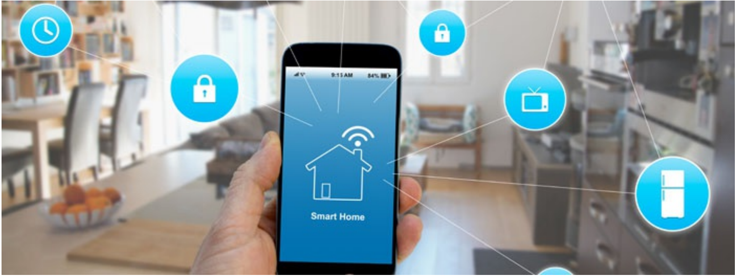
新加坡物聯網產品網路安全防护之初探