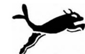
圖3 Sinda Poland欲申請之商標(註冊於尼斯分類第25類)

「本文同步刊登於TIPS網站 ( https://www.tips.org.tw ) 」