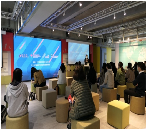
創業法律知識大公開!林口新創園舉辦「Skill-up Seminar」課程協助新創業者了解相關法律議題