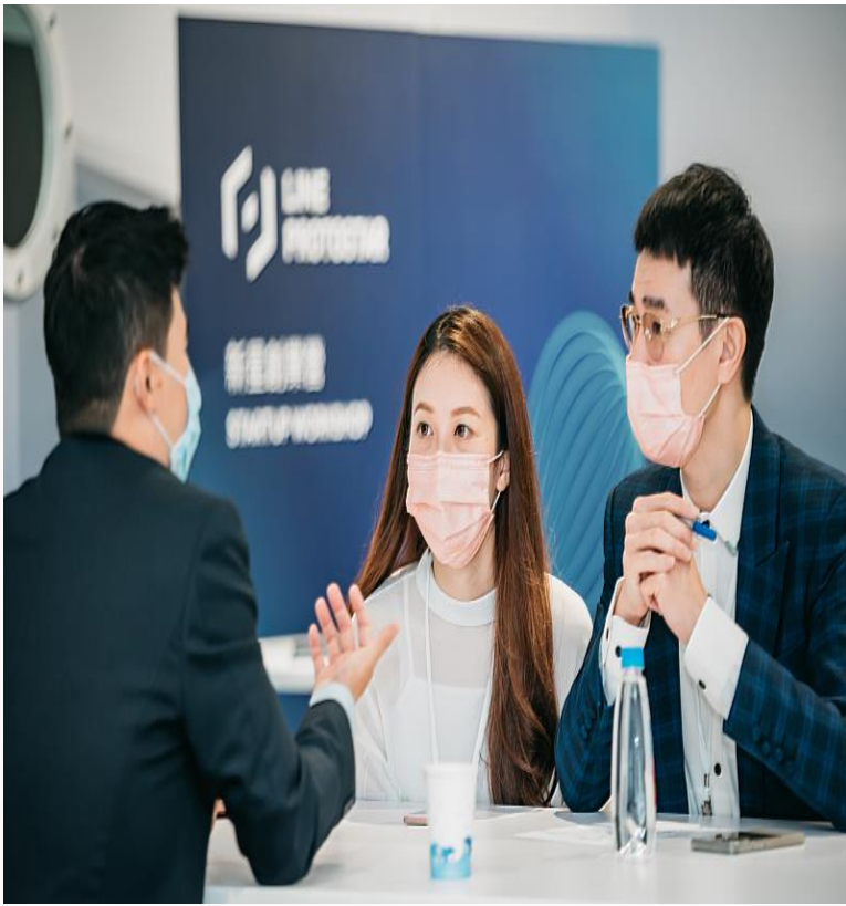
專業講師為與會學員進行1:1諮詢，內容包含商業計劃、財務、募資、法律等議題。

「新星創業營」結合 LINE PROTOSTAR 自 2015 年來累積的新創育成輔導經驗，並提供官方資源與專業諮詢輔導，為創業新星們打造創業必備知識與實務的工作坊，內容涵蓋「LINE 生態系與平台資源」、「商業計劃與財務預測」、「公司治理與盡職調查」、「海外商務拓展」四大主題，系統化幫助團隊掌握創業路上商業計劃、財務、募資、法律到海外拓展等細節。