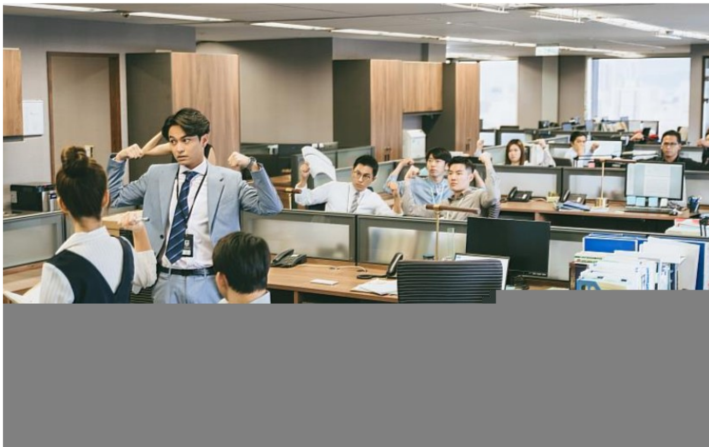
圖一：《最佳利益2-決戰利益》取景於資策會科法所辦公區。